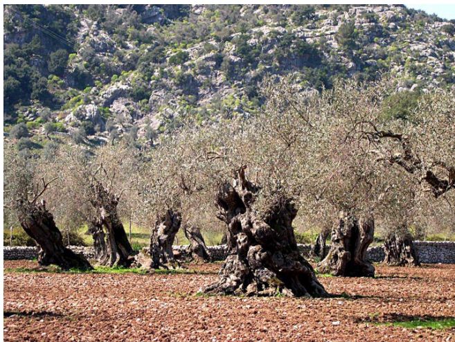
→ Arbre jusqu'à 10 m.