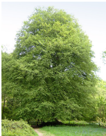
→ Arbre de 30 à 40 m.