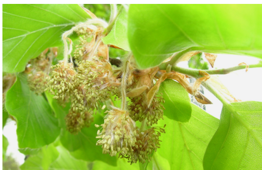
→ Fleurs mâles en châtons globuleux pendant à la base des jeunes rameaux.