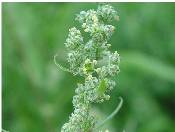
→ Fleurs en glomérules farineuses, en panicule étalée