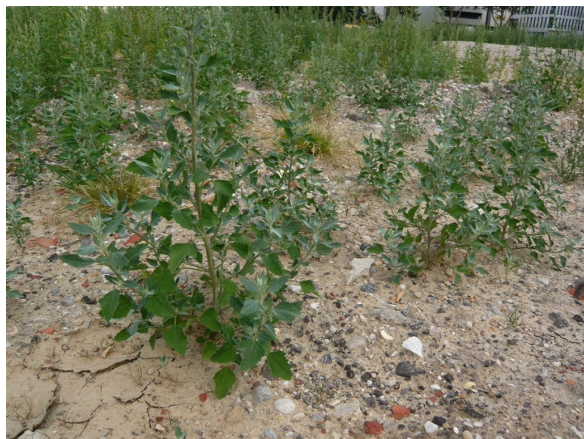
→ Herbacée de 20 cm à 1 m.