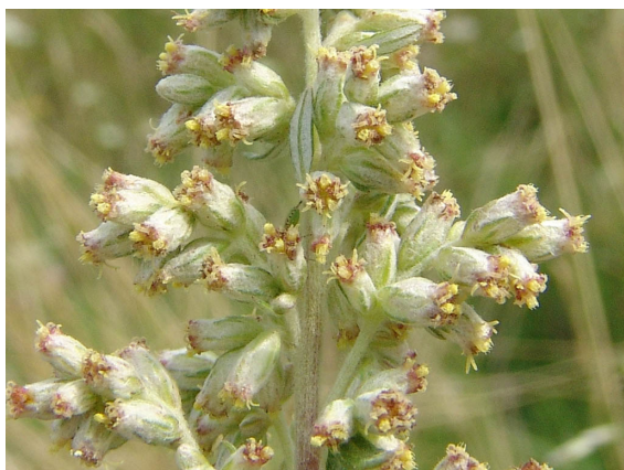
→ Fleurs tubuleuses en panicule compacte.