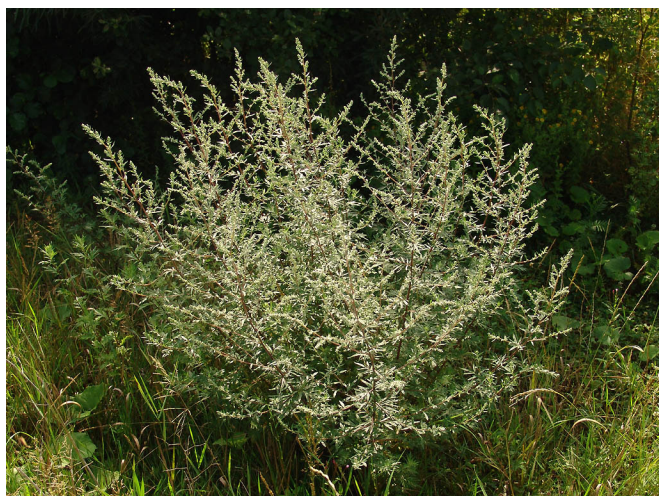
→ Herbacée de 30 cm à 1,5 m.