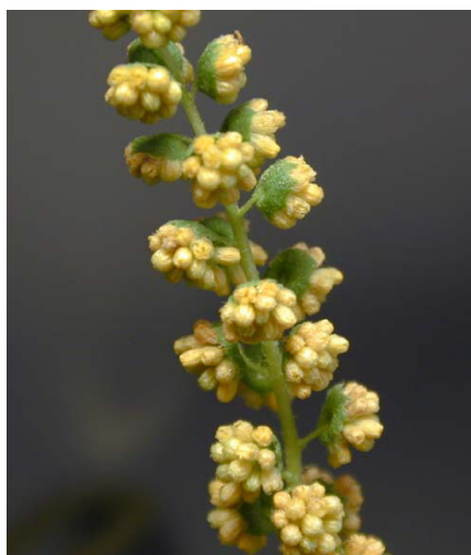
→ Fleurs mâles en petits capitules en épis terminaux.