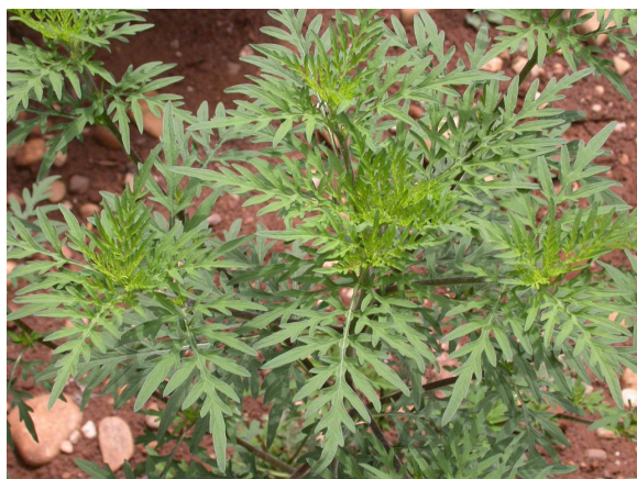
→ Herbacée de 30 cm à 1 m.